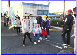
<西橋南側付近の様子>