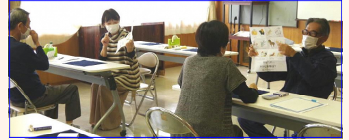
＜作った「相手の思ったページを当てるネタ」で互いに披露＞