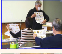
＜自己紹介マジックカード＞