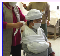
<頭部処置・腕の釣り方>