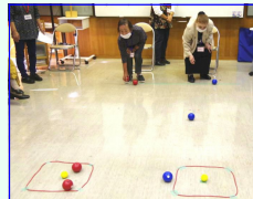
＜ダーツ：思うようには？＞ ＜ペタンク：的の近くへの寄せ方が難しい＞