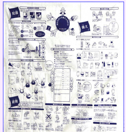
<減災ふろしき90cm四方>