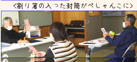
＜割り箸の入った封筒がべしゃんこに＞