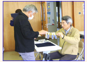
＜作った「相手の思ったカードを当てるネタ」で互いに披露＞