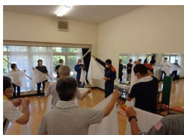
三角巾の応急訓練