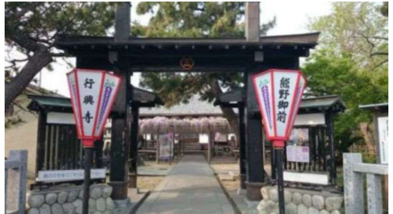
▲開花中、多くの花見客で賑わう行興寺の長藤

4月といえば「熊野の長藤」の季節です。つぼみも膨らみ、もうすぐ開花を迎えます。毎年、県内外から多くの花見客が訪れる熊野の長藤ですが、昨年同様に、門前通りの交通規制は行いません。来場者の駐車場は、天竜川渡し公園の南側に「臨時駐車場」を設けます。期間中、臨時駐車場の出入り口には「警備員」を配置し、来場者の安全対策を講じます。門前通りは来場者で混み合うと思いますので、交通事故には気を付けて通行して下さい。