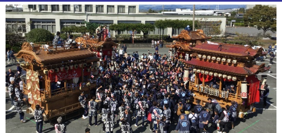
若宮八幡宮祭典 4町合同イベント 子供たちの楽しそうな声が響いていました