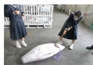
【2年フィールドワーク】