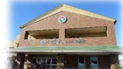
聖隷こども園こうのとり豊田 園舎