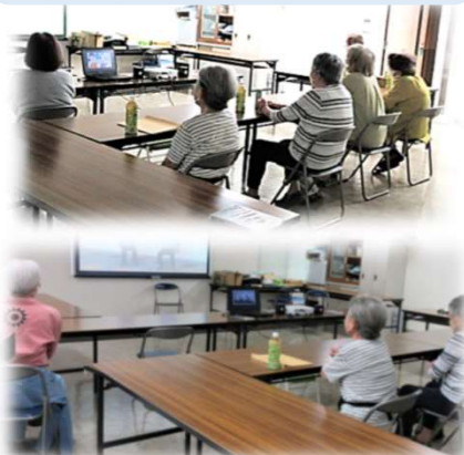
Jハイム豊田立野自治会 ふれあいサロン