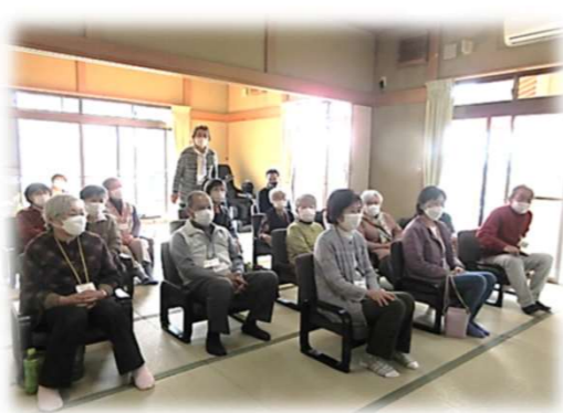
立野自治会 ふれあいサロン立野