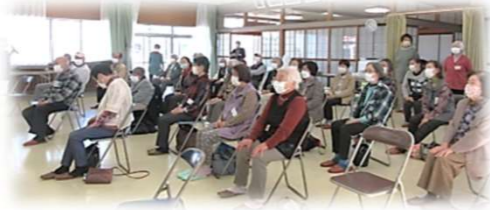
下本郷自治会 下本郷なかよしサロン