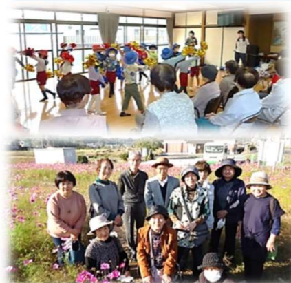
中田自治会 中田なかよしサロン