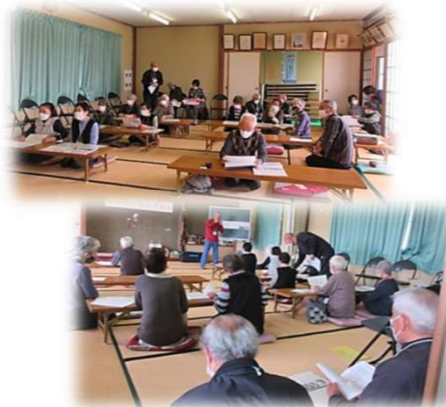
森本自治会 森本ふれあいサロン