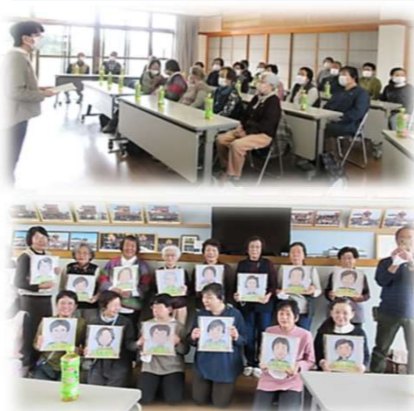
気子島自治会 なかよしサロン気子島