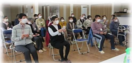
海老塚自治会 銀杏の里