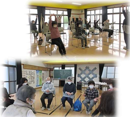
宮之一色自治会 一色サロン