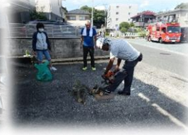
チェーンソー訓練