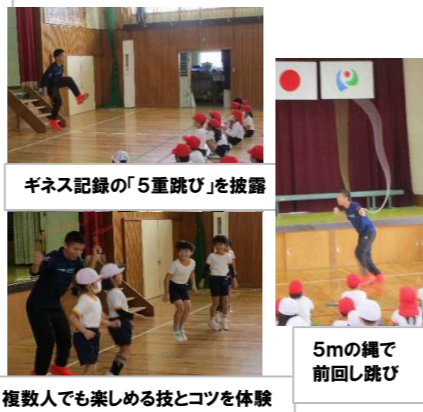
ギネス記録の「5重跳び」を披露