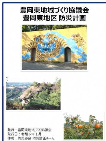
発行：豊岡東地域づくり協議会 発行日：令和6年1月 作成：防災部会 防災計画チーム