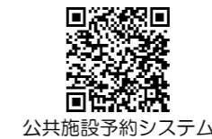
公共施設予約システム

予約方法の操作手順は市ホームページをご覧ください。 4.システムへの利用者登録 個人利用者: 過去の交流センターの利用状況に関わらず利用者登録が必要です。 団体利用者: これまでに交流センターを利用したことがない団体は、事前にシステムへの利用登録が必要です。(体育施設等で本システムを利用している場合は、交流センターまでご相談ください) 5.予約や登録情報の修正、新規登録のシステム操作が難しい場合は、交流センター窓口にご相談ください。 この内容は「広報いわた(令和5年12月号)」や磐田市のホームページにも掲載しています。