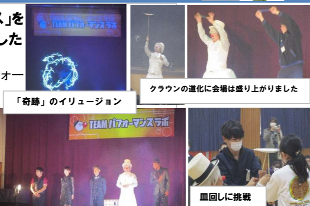
「奇跡」のイリュージョン

参加型のパフォーマンスもあり、職員が舞台上がりパフォーマンスを披露をしたり、子どもたちが血回しに参加したりしました。子どもの満足度はとても高かったです。