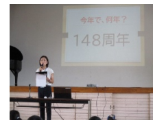
集中して話を聞く姿が立派です

校長からは、クイズ形式で豊岡南小学校の創立(開学)からの歴史について、紹介がありました。また、地域の方にとって歴史と伝統のある学校をこれからもみんなで大切にしていきたい、という話がありました。暑い中でしたが、子供たちの集中して話を聞く姿がすばらしかったです。