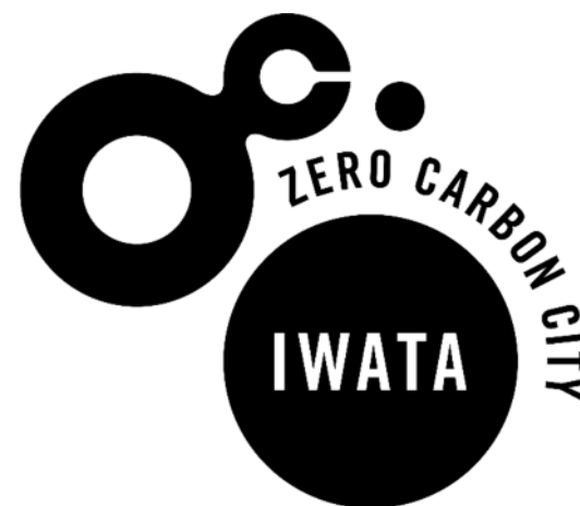
【白抜きで使用する場合】