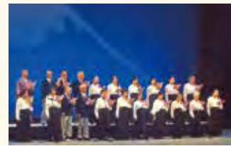
▲公演 (舞台部門発表)