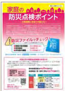
▲家庭の防災点検ポイント (8月上旬全戸配布)