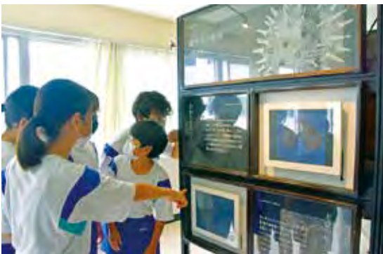
化石標本に興味津津の竜洋中の生徒

竜洋中学校で「ふじのくに地球環境史ミュージアムの移動型展示『ミュージアムキャラバン化石の世界』」が行われました。