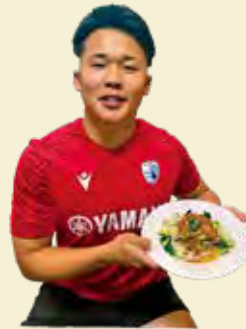
パンチの効いた白身魚は食欲が落ちる夏にぴったり!