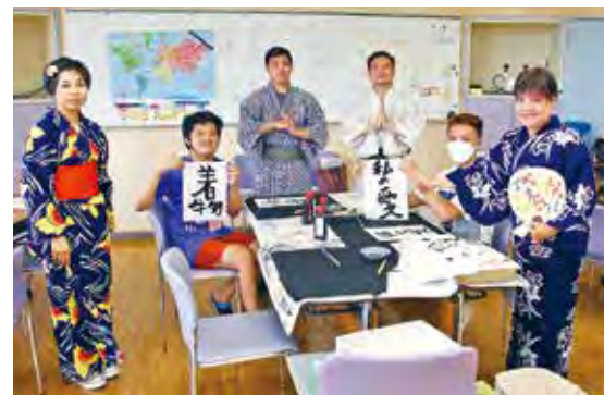
日本文化を体験する外国人の皆さん

竜洋交流センターで、磐田市日本語教室に通う外国人に日本文化体験が開催され、浴衣の着付けや書道、けん玉など、昔の遊び体験を行いました。また、当日は竜洋西会館でも日本文化と音楽に触れる体験会が行われました。