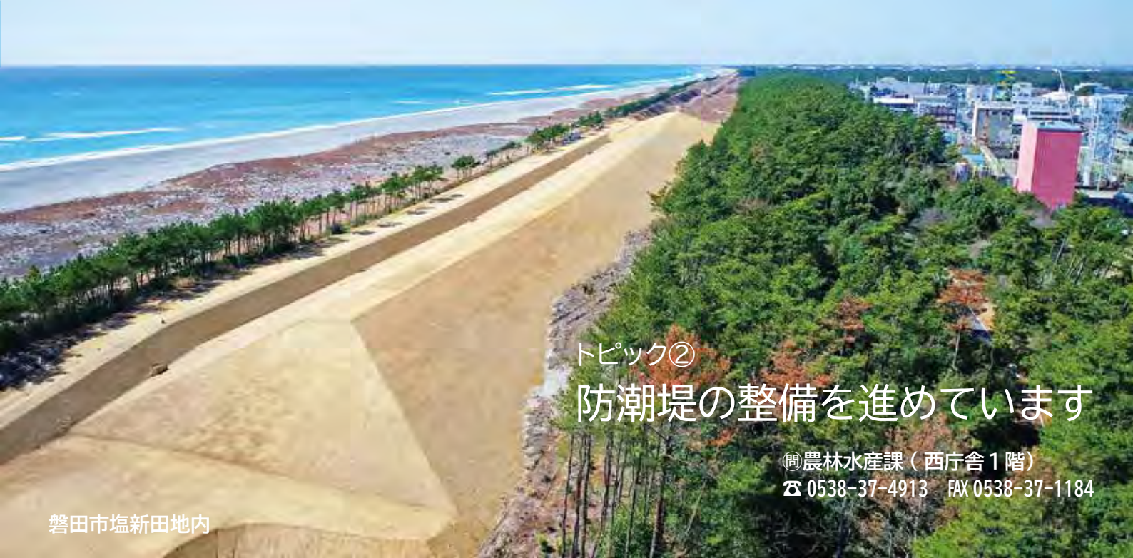
磐田市塩新田地内