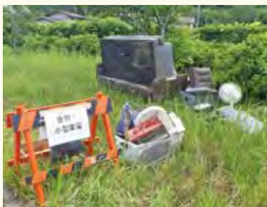
▲地域の広場に分別して出された災害廃棄物

大規模災害が発生した場合に備え、地域で災害廃棄物を一時的に出せる場所や出し方をあらかじめ話し合っておくこともご検討ください。