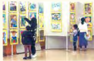
▲ジュニアアートの部