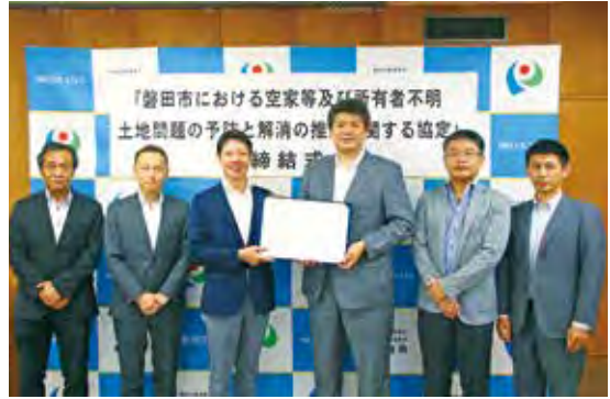
協定を締結した静岡県司法書士会の皆さんと市長

静岡県司法書士会と「磐田市における空き家等及び所有者不明土地問題の予防と解消の推進に関する協定」を締結しました。「所有者不明土地」を明記した協定を締結するのは、県内で磐田市が初となります。