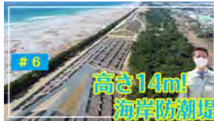
▲ YouTube チャンネル「磐田TV」 「市長の今日はここから（防潮堤編）」

津波による被害から皆さまの生命・財産を守るために、今後も引き続き防潮堤の整備を進めてまいります。