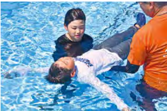
浮遊体験をする岩田小学校の児童

岩田小学校で水の事故から自分の命を守る方法を体験するため、全学年が着衣泳を実施しました。三ヶ日青年の家の方の指導を受けながら子どもたちは着衣をしたまま水に入り、静かに浮いて助けを待つ方法やペットボトルを利用した浮遊体験をしました。