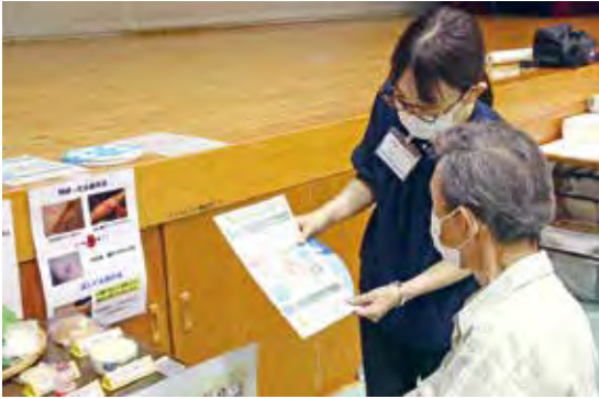
受診者に熱中症予防の説明をする市職員

ワークピア磐田で行われた特定健診・がん検診の受診者約 60 人に、熱中症予防の啓発活動を行いました。