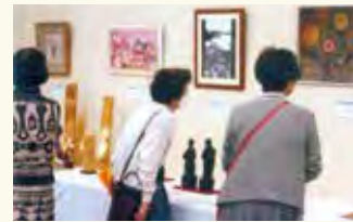
▲工芸・クラフトの部