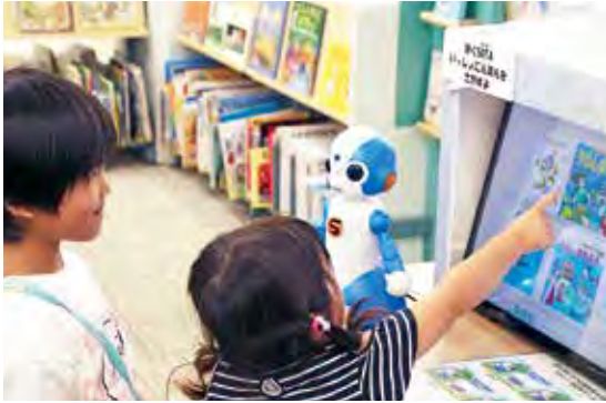
「びたりえタッチ」で遊ぶ子どもたち

子どもの読書活動の推進を図ることを目的に、NTT(株)、NTT印刷(株)、磐田市の三者で締結した連携協定に基づき、AI絵本推薦システム「びたりえタッチ」がひと・ほんの庭 にこっとに試験導入されました。