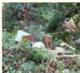
▲山中に捨てられたごみ

は警田警察署と連携して厳しく対応しています。また、通報などによるごみの回収を行っています。