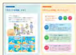
▲ガイドブックから一部抜粋

今後は、作成したガイドブックを活用し、自治会や企業に向けても出張研修を行い、周知を図ります。