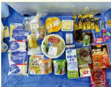
▲未使用・未開封のまま捨てられている食品

令和2年度「磐田市可燃ごみ内容物調査」によると、市内の家庭から排出される食品ロスの量は年間約1680トンで、食べ残しや未開封・未使用のまま捨てられている食品が生ごみのうち約2割を占めています。