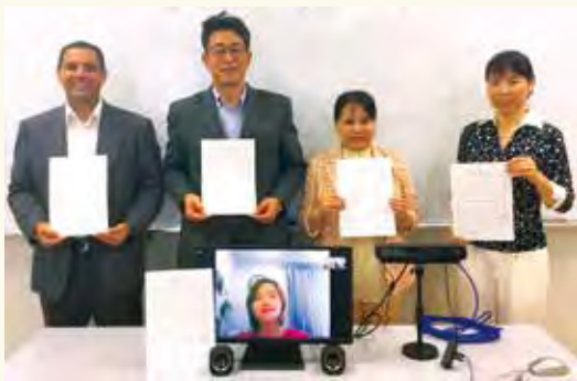
▲外国人アンバサダーの皆さん

市の発信する情報は、外国人市民に届かない、分かりにくい、興味を持っていないなどの問題がありました。アンバサダーがより多くの人に、分かりやすく、届けてくれます。知らない・分からないことで、トラブルにならないようにします。