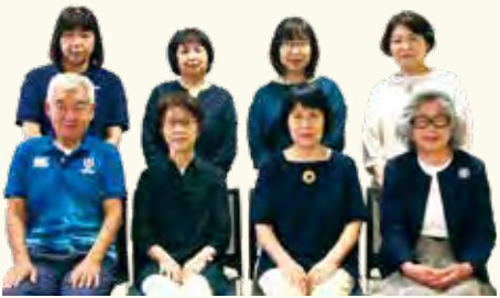
▲市内で活動する介護相談員