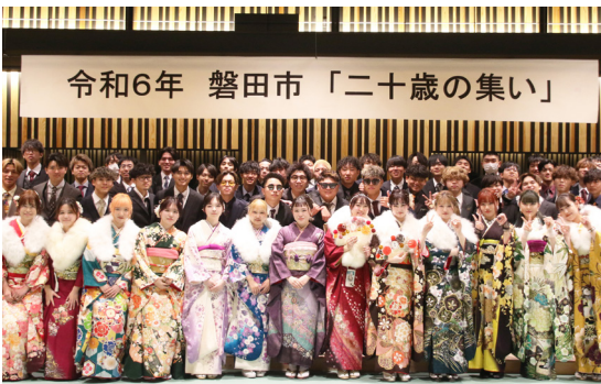
出身中学校ごとに記念撮影をする出席者たち

磐田市民文化会館かたりあで二十歳の集いが開催され、約1,500人が新たな門出を迎えました。市内全域の20歳が一堂に会する式典の開催は初めてとなり、出席者の皆さんは旧友との再会を喜ぶ合うなどして、楽しいひと時を過ごしました。