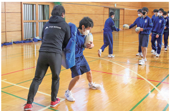
タックルに挑戦する中学生

向陽中学校2年生約60人が静岡ブルーレヴズホストゲーム中学生一斉観戦を盛り上げるため、静岡ブルーレヴズのスタッフによるラグビー講座とラグビー体験を行いました。