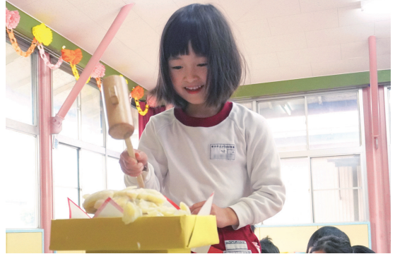
餅つき体験で作った鏡餅を木づちで割る園児

磐田南幼稚園で鏡開きが行われ、園児約40人が鏡餅を割り、新年の健康などを祈りました。