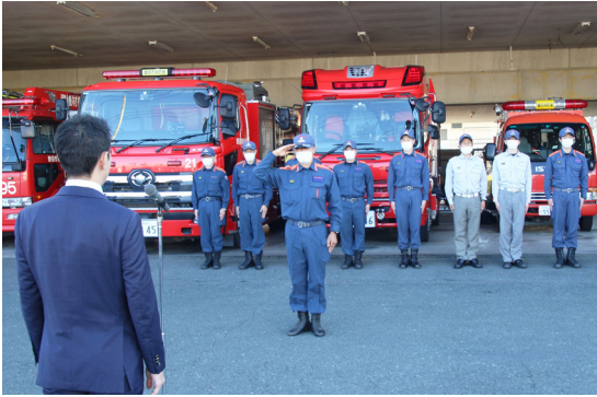
石川県に人命救助に向かう緊急消防援助隊

1月1日に発生した能登半島地震により緊急消防援助隊静岡県大隊として、磐田市消防本部から2次派遣隊9人を石川県に派遣しました。