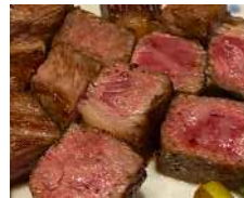
鉄板焼き (イメージ)