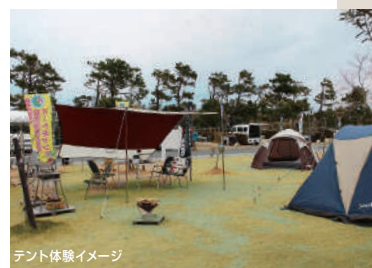
テント体験イメージ