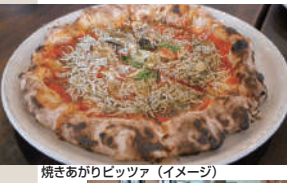
焼きあがりピッツァ (イメージ)