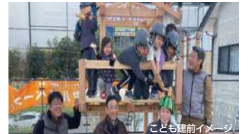
こども建前イメージ

家づくりの始まりを意味する「建前(たてまえ)」。骨組みを組み上げる重要な工程で、完成後には「上棟式」と呼ばれるお祝いも行われます。本プログラムでは、4人のプロの大工とともに、高さ約2メートルの木の骨組みを組み立てる体験ができます。安全面にも十分配慮して実施しますので、小さなお子さまも保護者の方と一緒にご参加いただけます。自分の手で建てた“ちいさなおうち”は、きっと特別な思い出に。未来の大工さんのご参加をお待ちしております。