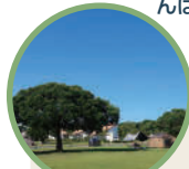
キャンプ場フリーサイト

「興味はあるけど、やり方がわからない…」そんなキャンプ未経験の方を対象に、テントやタープの設営・撤収をスタッフがやさしくレクチャー。さらに、炭火おこし体験や、みんなでお楽しみBBQタイムもご用意(BBQ用の食材は料金に含む)。さらに!いわたおんぱく特別企画として、キャンプ場内をぐるっとめぐる「見学ツアー」も開催!普段は未公開の“コテージ”の特別見学も!秋の自然の中で、気軽にアウトドア体験!人生に新たな楽しみを加えてみませんか?