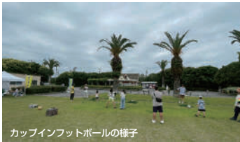
カップインフットボールの様子

日時 11/9[日] 10:00~11:30 目指せカップイン!見事にナイスイン!