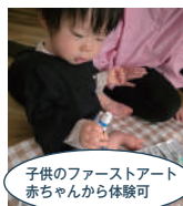
子供のファーストアート 赤ちゃんから体験可

絵の具や素材の質感を楽しみながら、自由に手を動かすテクスチャーアートと、深い呼吸とともに香りが心を包むアロマセラピーを組み合わせた優しく心と身体を整える90分のプログラムです。アートが乾く間には、今のあなたに寄り添う香りのブレンドを選んで頂きながらハーブティーをお楽しみいただけます。五感を満たし、心と身をやさしく整える時間です※お子様はアートの体験のみです(アロマ抜き1時間のプログラムです)。