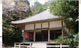
岩室廃寺跡、観音堂