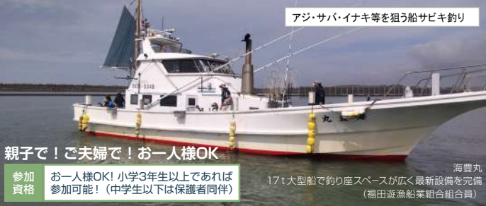
アジ・サバ・イナキ等を狙う船サビキ釣り