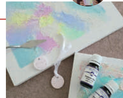
テクスチャーアート(イメージ)