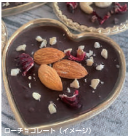
ローチョコレート (イメージ)

非焙煎のカカオパウダーを使用したカカオ分の高いローチョコレートを手作りしながら、【美と癒し】を育むカカオのパワーを体感。ローチョコレートがはじめての方も、チョコ好きな方も大歓迎! ご自身で作ったローチョコレートはお持ち帰りできます。講師が用意したローチョコレートとドリンクのティータイム付き。カカオの香りに包まれながら、心がふっと緩むようなひとときをご一緒にしませんか?