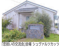
恋拾いの交流会会場 シュヴァルツカッツ