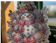
作品はイメージです。作る物に変更になる場合があります。