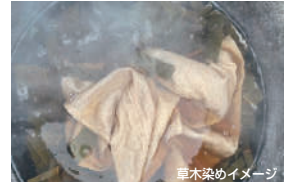
草木染めイメージ