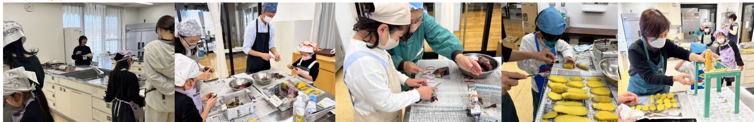
おいしい干し芋をつくるには

1月18日曜日、「全2回」親子で食育磐田北部おいしいものの体験講座が豊岡中央交流センターで行われました。この講座は磐田北部の豊岡東・豊岡中央・向笠・大藤・岩田交流センターの5館が合同開催したものです。昨年の11月22日に1回目が行われ干し柿づくり、2回目のこの日はお茶の入れ方を教わったり、干し芋作りをしました。ちなみに干し芋担当は岩田交流センターでした。