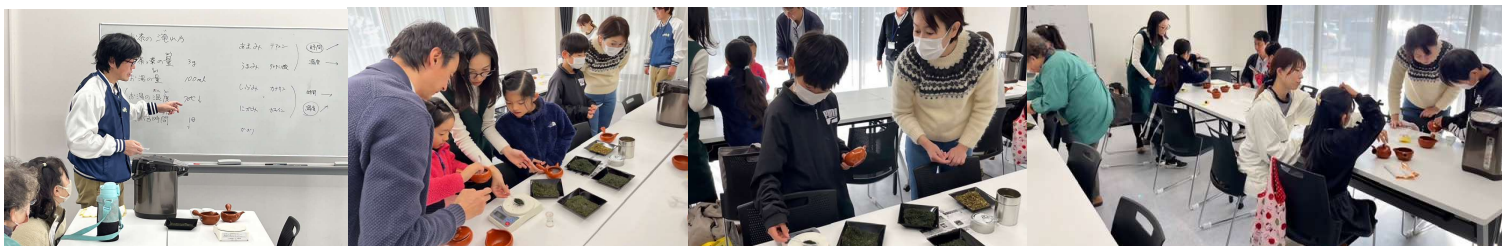
おいしいお茶を入れるには