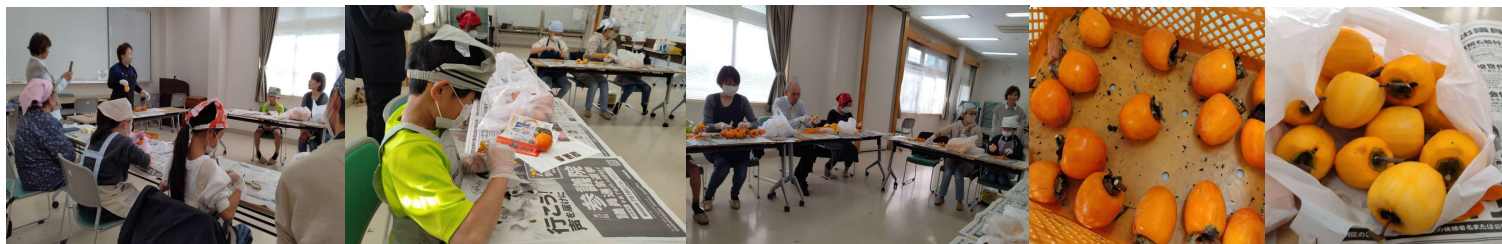
おいしい干し柿をつくるには