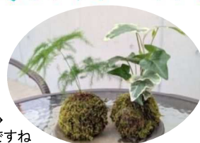
見本です → → → ころっとしてかわいいですね