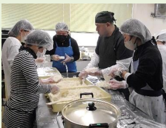
アルファ米炊き出し

今回は、緊急時に対応可能な訓練を念頭に、訓練校の体育館全面を使って住居スペースを確保し、小型テントの組み立てやマットへの空気入れなど、実際に即した訓練を体験しました。