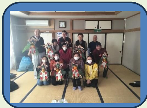
しめ飾り講座の皆さん

12月のしめ飾り講座の皆さんとその力作です。また、「つわぶきの会」「なでしこ会」の作品は交流センターの玄関ホールに展示しています。