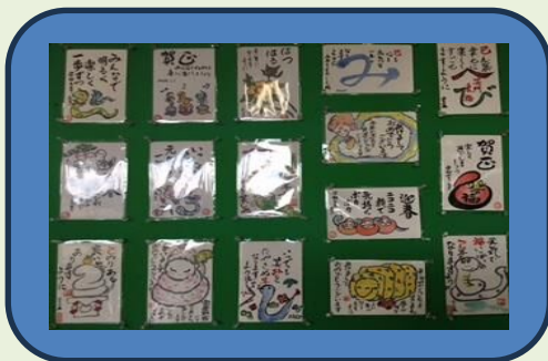
なでしこ会の作品