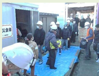
地域防災倉庫点検など