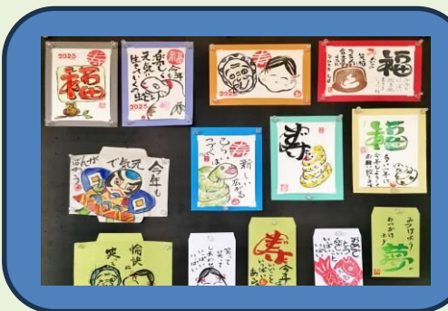
つわぶきの会の作品