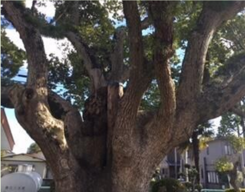
西貝交流センターの楠木

交流センターに茂る「楠の大樹」と「ひょうたん池」は、西貝地区の自然保護と憩いのシンボルです