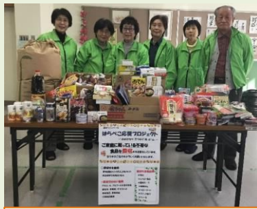
今回も多くの食料が集まりました ご協力ありがとうございました

なお、この活動は「福祉委員会」が引き継いで今後も継続させていただきますので、今後ともご協力をお願いいたします。