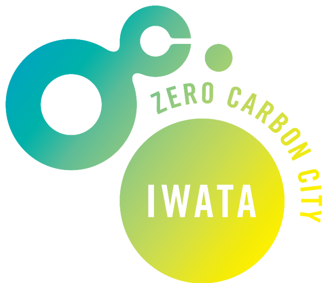
ゼロカーボンシティいわたロゴマーク