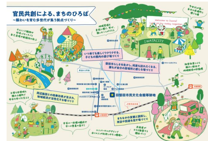
※基本方針に沿った機能イメージ(確定した整備計画ではありません)