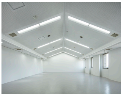
▲ギャラリー1