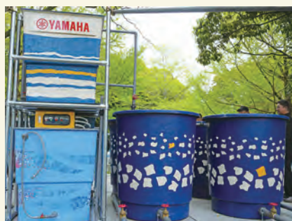
▲ヤマハクリーンウォーターシステム

自然の水浄化の仕組みを応用し、装置近くを流れる水をくみ上げ、前処理やバイオ、ろ過など計8槽で浄水します。アジアやアフリカの水道設備が行き届かない国・地域を中心に導入されています。