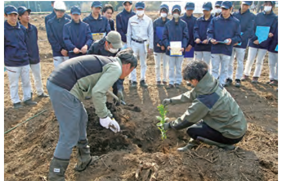
レモンの苗木を定植する様子

株式会社 LEMONITY の農場で「レモン定植祭」が開催されました。約4haに2,000本の苗木を植える大規模な定植を行い、今後100~120tの収穫を目指しています。