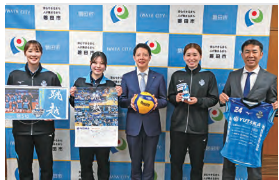
表敬訪問したブレス浜松の選手たち

2025-26 V.LEAGUE シーズンの終了に伴い、静岡県西部を拠点に活動する女子バレーボールチーム「ブレス浜松」の選手らが市長を訪問しました。