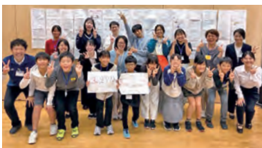
▲令和7年度こども若者会議の参加者