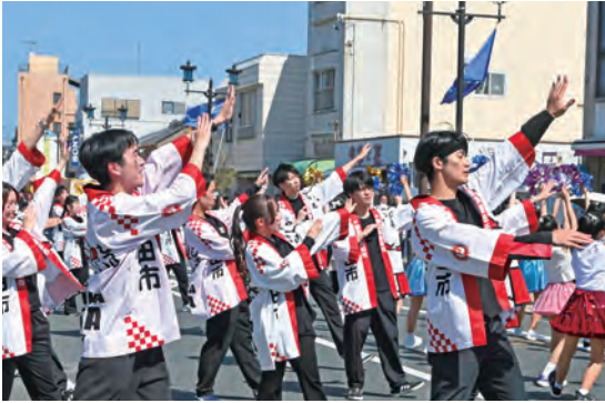
舞車おどりを披露する参加者たち

見付宿場通り周辺で「いわた大祭り 遠州大名行列・舞車」が開催され、多くの来場者でにぎわいました。