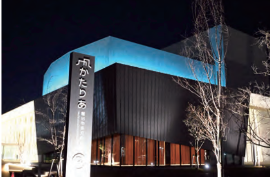
ブルーにライトアップされた市民文化会館「かたりあ」

国連が定める「世界自閉症啓発デー」と、日本において実施される「発達障害啓発週間」は、自閉スペクトラム症をはじめとする発達障害について、正しい理解を広げるとともに、支援の大切さを社会全体で考えるための大切な機会とされています。