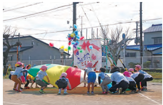
豊田北保育園でパラバルーンを披露する園児たち

豊田北保育園・豊田北部幼稚園の閉園式が行われ、69年・46年の歴史に幕を下ろしました。