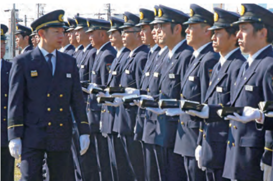
消防点検実施の様子

今之浦公園で市長による消防本部の通常点検が行われ、約130人の消防職員が参加しました。点検では、姿勢や服装、礼式などを確認し、日頃の訓練の成果と規律の徹底を確かめました。