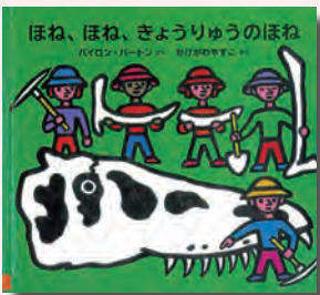
パイロン・バートン/さく かけがわ やすこ/やく (ポプラ社)

いい歯のおはなし会／6日(土)15時～ 予 ブックススタート／4日(水)・13日(土)午後6～8月くらい市の親子対象(引換券持参) おはなしポンポコリン／10日(水)10時30分～ ちいさなおなべのおはなし会(ストーリーテリング)／10日(水)15時～